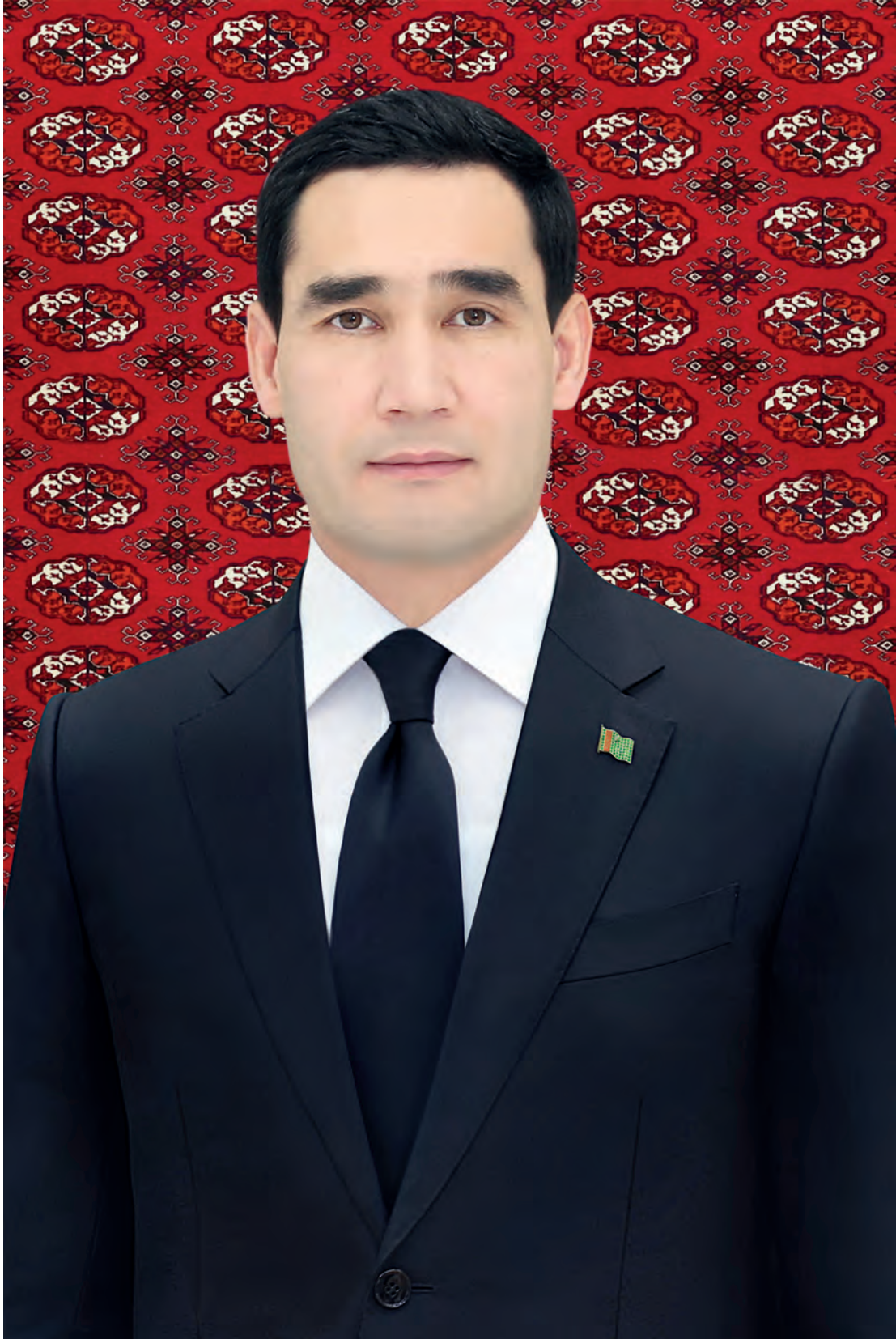
TÜRKMENISTANYŇ PREZIDENTI SERDAR BERDIMUHAMEDOW