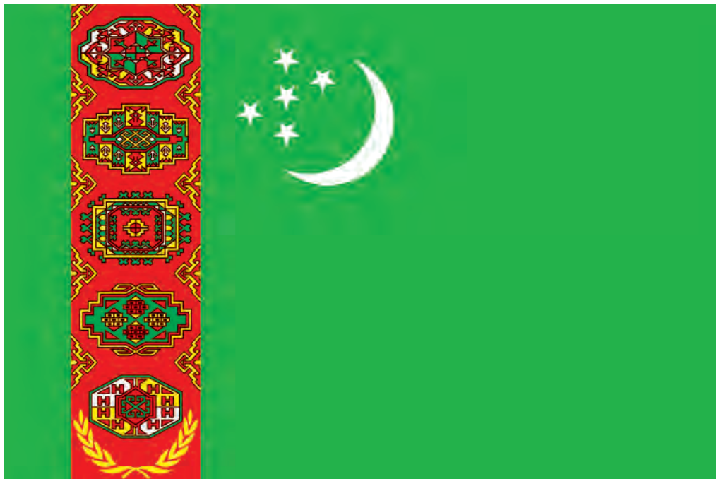
TÜRKMENISTANYŇ DÖWLET BAÝDAGY