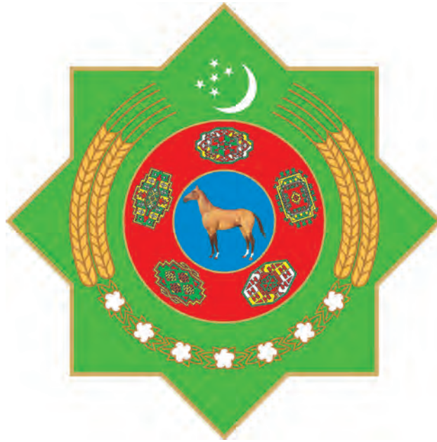
TÜRKMENISTANYŇ DÖWLET TUGRASY