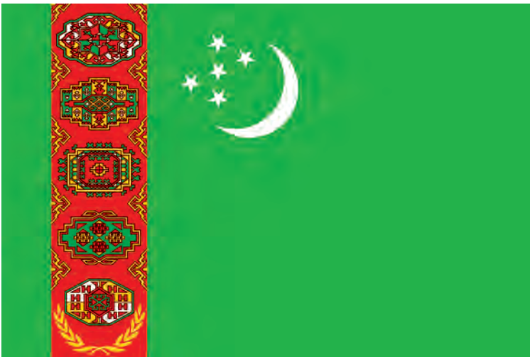
TÜRKMENISTANYŇ DÖWLET BAÝDAGY