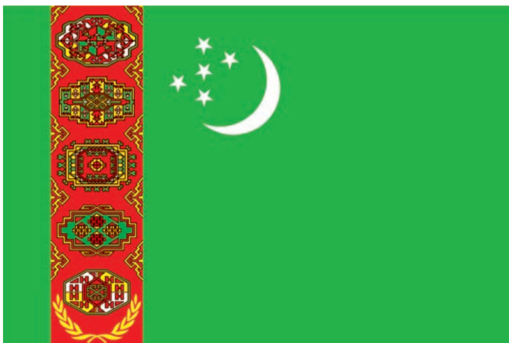
TÜRKMENISTANYŇ DÖWLET BAÝDAGY