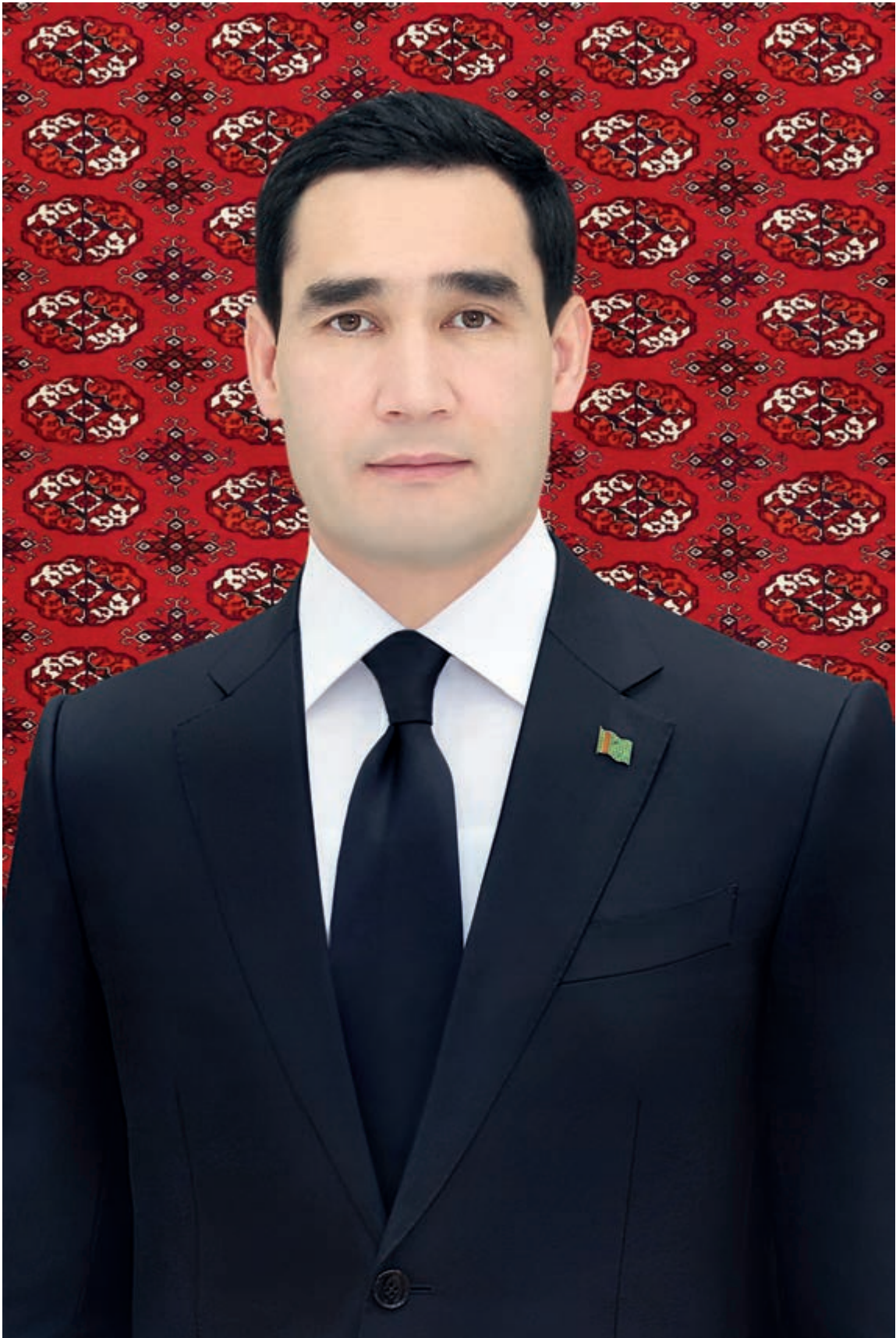
TÜRKMENISTANYŇ PREZIDENTI SERDAR BERDIMUHAMEDOW