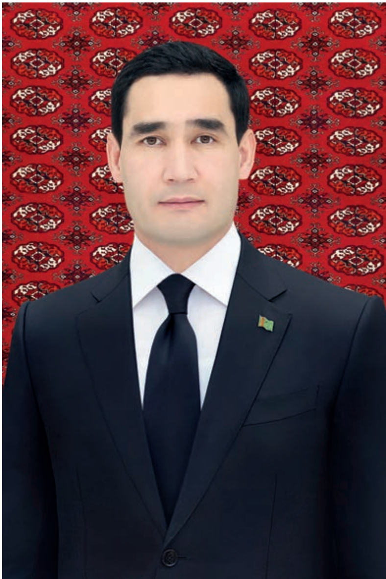
TÜRKMENISTANYŇ PREZIDENTI SERDAR BERDIMUHAMEDOW