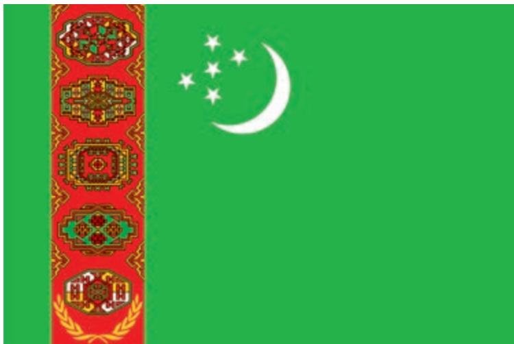
TÜRKMENISTANYŇ DÖWLET BAÝDAGY