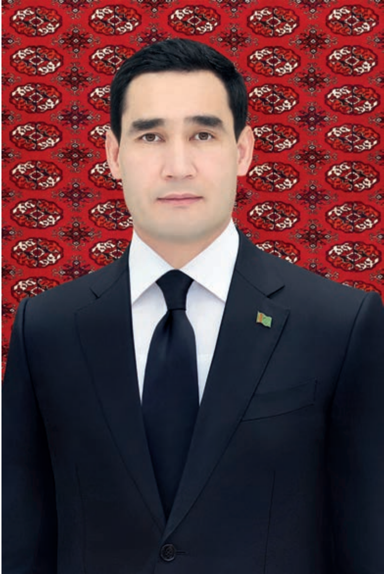
TÜRKMENISTANYŇ PREZIDENTI SERDAR BERDIMUHAMEDOW