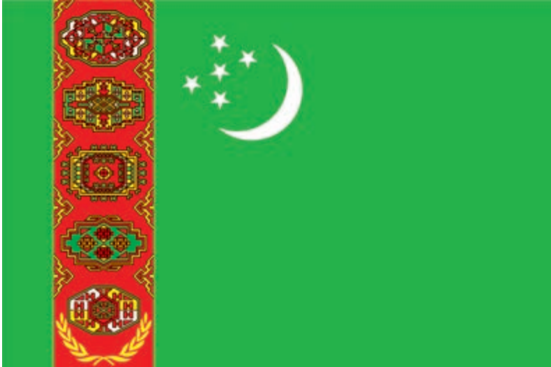
TÜRKMENISTANYŇ DÖWLET BAÝDAGY