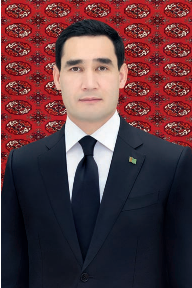
TÜRKMENISTANYŇ PREZIDENTI SERDAR BERDIMUHAMEDOW